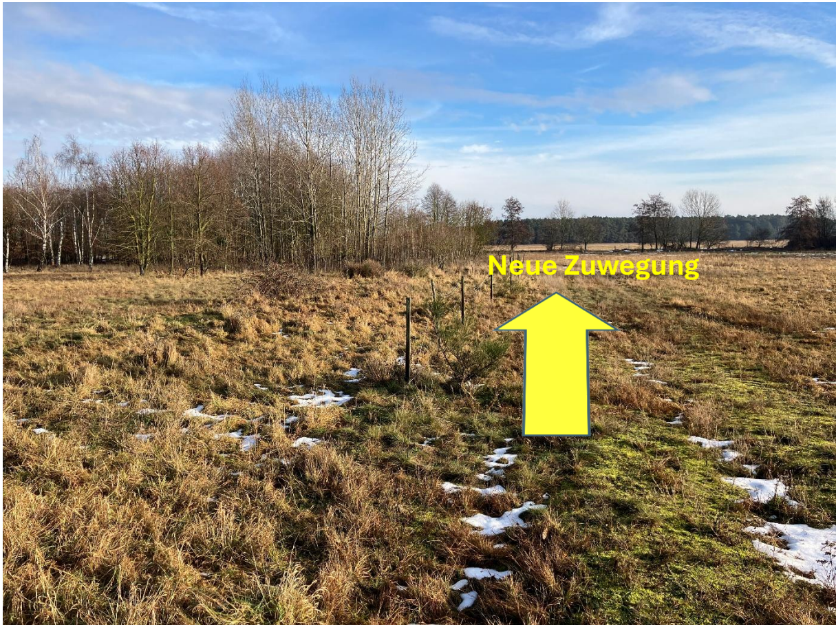
Abbildung 1: Foto zur groben Visualisierung des Zuwegungsverlaufs zur Baustelle